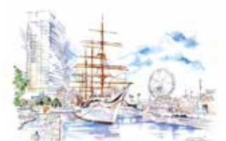
⑪ 帆船日本丸と観覧車