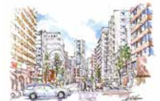
③ 平沼交差点からランドマークを臨む