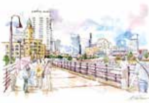
⑦ 象の鼻パークよりみなとみらいを臨む