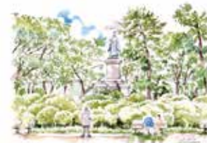
④ かもんやま 掃部山公園