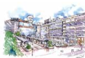
⑨ 横浜駅西口 駅ビル 2012