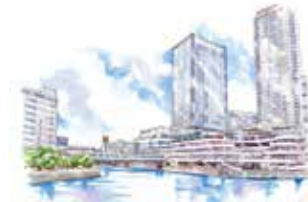
⑩ 横浜バイクオーター