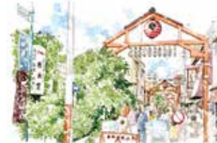
⑤ 野毛 柳通り