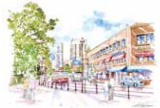
⑧ 開港広場前交差点