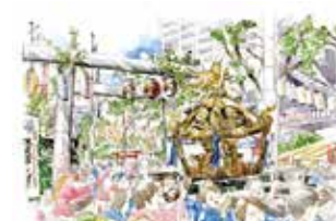
⑬ 水天宮平沼神社 例大祭