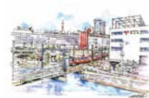
② 京浜急行が走る横浜駅東口