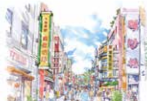
⑫ 横浜中華街大通りを臨む